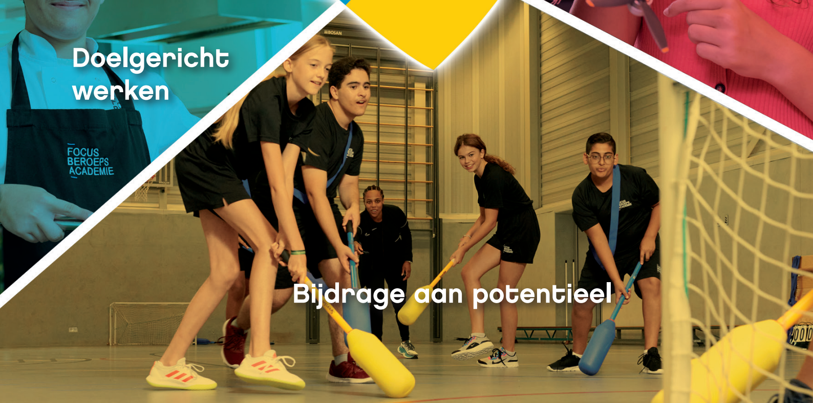
Bijdrage aan potentieel