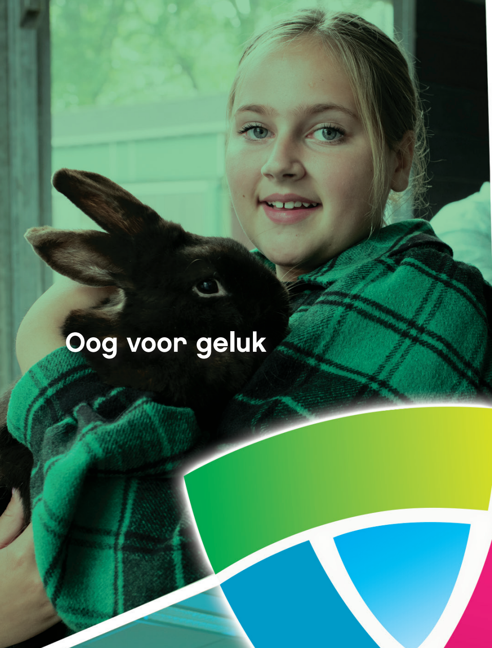
Oog voor geluk